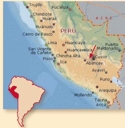
Lage des Missionsspitals in Südperu im Zentrum der Quechua-Kultur

Der Verein Diospi Suyana verfolgt ein Projekt, das vorsieht, ein Missionskrankenhaus für die Indianer Perus zu betreiben. Menschen, die in größter Armut leben, erhalten eine medizinische Grundversorgung. Mit dieser Initiative löst der Verein Diospi Suyana jene Verantwortung ein, die wir als Christen und Europäer gegenüber der Urbevölkerung Südamerikas tragen. Ich danke den Initiatoren für dieses Projekt von ganzem Herzen.