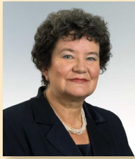
Prof. Dr. -Ing. habil. Dagmar Schipanski

Präsidentin des Thüringer Landtags und der Deutschen Krebshilfe