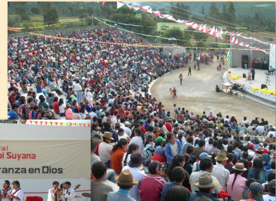
Volles Haus und beste Stimmung beim Fest