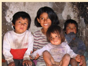
Indianerkinder in ihrer Hütte etwa zwei km vom Krankenhaus entfernt

Diospi Suyana e. V. Hinweis »mildtätig« BB Bank Karlsruhe Konto-Nr. 5 394 031 BLZ 660 908 00