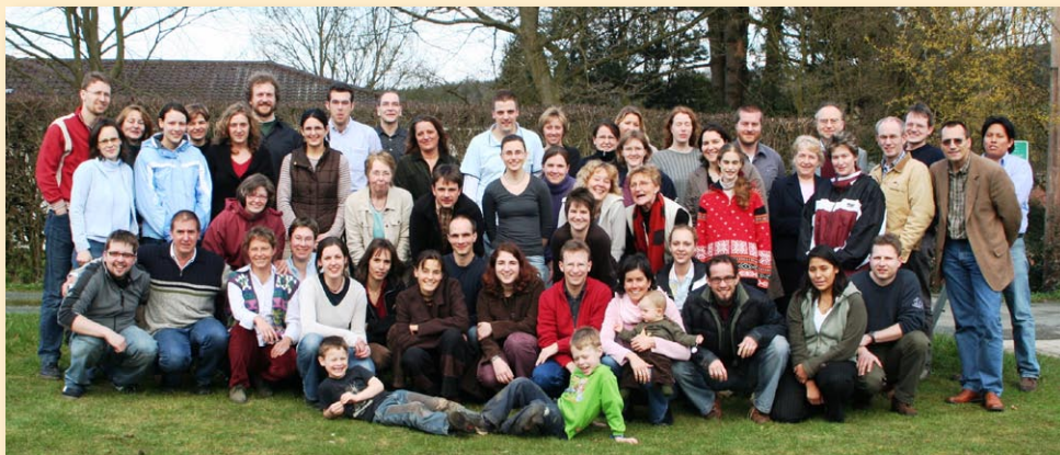
▲ Diese Gesichter verraten alles - eine hochmotivierte Truppe voller Enthusiasmus

Mitarbeitertreffen in Solms. Bis zum Jahresende wird das Team in Peru auf 20 freiwillige Mitarbeiter angewachsen sein.