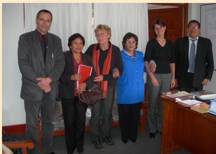
▲ Nach der Unterschrift ein Foto