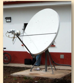
▲ Die Satellitenschüssel

Im Januar 2008 machte der Chef von Global Crossing Peru (früher IMPSAT) sein Versprechen wahr. Eine neue Satellitenschüssel für sechs internationale Telefonlinien und 25 Internetverbindungen wurde installiert. Die Hardware, Software und alle Gebühren sind eine Spende, die pro Jahr bei 50.000 USD liegt.