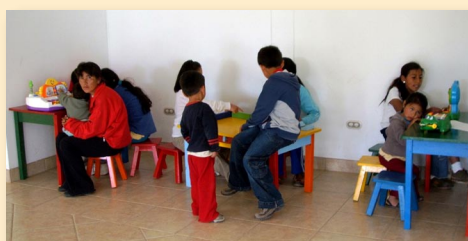
Kinder in der Spielecke des Wartesaals

Diospi Suyana e. V. Hinweis »mildtätig« BfS Köln Konto-Nr. 8 073 700 BLZ 370 205 00