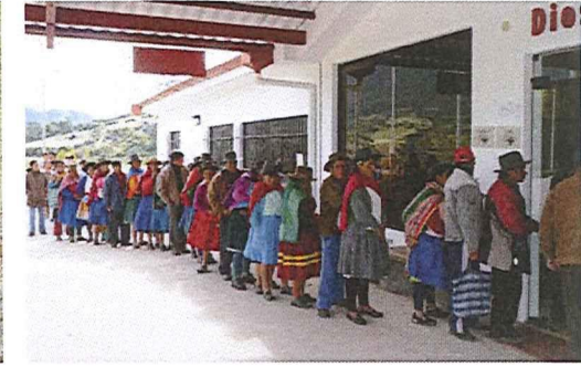
... vor dessen Toren täglich Patienten Schlange stehen – die meisten von ihnen Quechua-Indianer.

für das Krankenhaus zu engagieren – vom Steinschlepper über die Ärztin bis hin zum Bauleiter. Im Oktober 2003 beziehen die Johns mit ihren drei kleinen Kindern eine Lehmhütte in Curahuasi, ein paar Monate später beginnen sie, Spenden einzutreiben. Sie reisen quer durch Deutschland, halten Vorträge in Kirchengemeinden, Schulen und Vereinen, schreiben Briefe, entwerfen Flyer und die Homepage www.diospi-suyana.org , führen unzählige Telefonate. Ein Jahr unermüdete, harte Arbeit. Am Ende sind 300.000 Euro auf ihrem Konto eingegangen – nicht mal ein Zwanzigstel des Geldes, das sie brauchen. Nüchtern betrachtet ist das Projekt »Krankenhaus des Glaubens« am Ende.