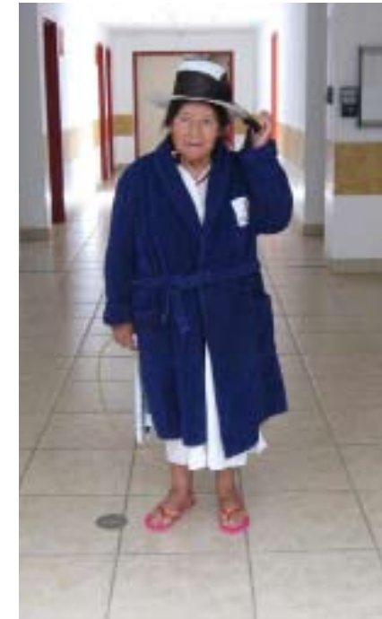
Eine Patientin auf dem Krankenhausflur

Unsere Aufgabe sollte sein, einerseits diese Abteilung neu aufzubauen und zu entwickeln, andererseits natürlich Patien-