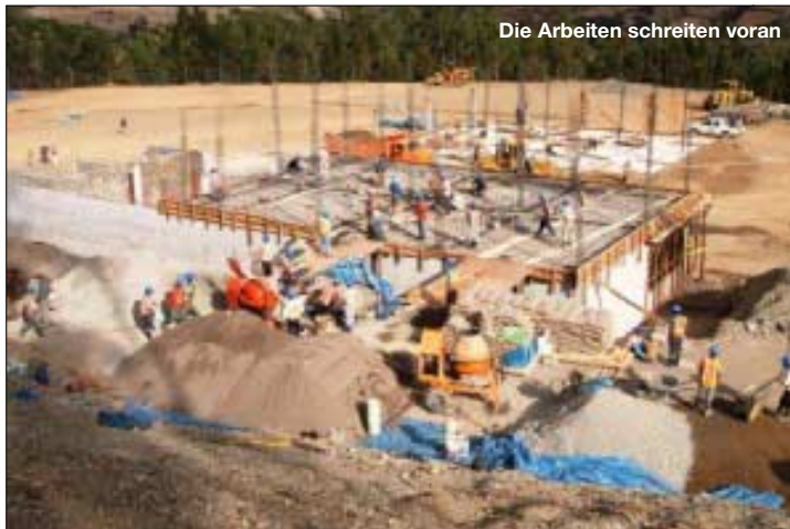
Die Arbeiten schreiten voran

(Gabun) ging, um dort mit primitivsten Mitteln ein Krankenhaus aus dem Boden zu stampfen. Das Weitere ist sicher vielen von unseren Lesern bekannt.