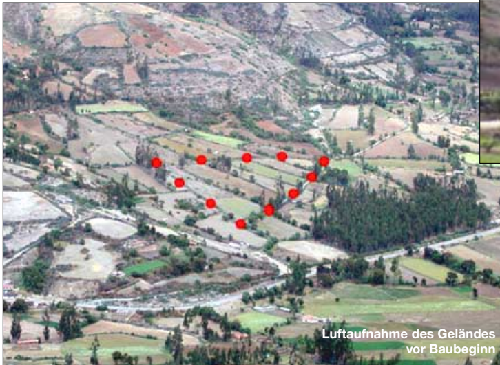
Luftaufnahme des Geländes vor Baubeginn

C urahuasi – das klingt so, als hätte es etwas mit Kurieren, mit Heilen zu tun. Das stimmt, ist aber Zufall. In Curahuasi entsteht etwas, was bisher dort niemand zu denken oder auch nur zu hoffen gewagt hätte: Ein Krankenhaus, nein viel mehr, ein medizinisches Zentrum für die Ärmsten der Armen, denen Worte wie Krankenhausaufenthalt oder Arztsprechstunde völlig fremd sind.