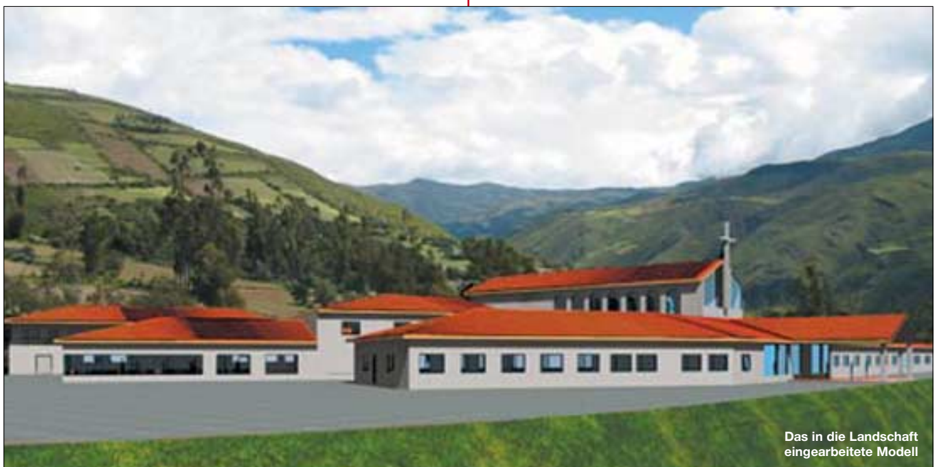
Das in die Landschaft eingearbeitete Modell

Curahuasi ist ein kleines Landstädtchen im Süden Perus in der Provinz Apurimac. Man bezeichnet diese Gegend als das Armenhaus Perus, und das will bei der für weite Bevölkerungsteile Perus wirtschaftlich schwierigen Lage schon etwas heißen. Hier leben vor allem die direkten Nachkommen der alten Quechua-Bevölkerung, die noch immer eine Kultur von hoher Entwicklung repräsentieren. Leider spielten einige unrühmliche Spanier vor ein