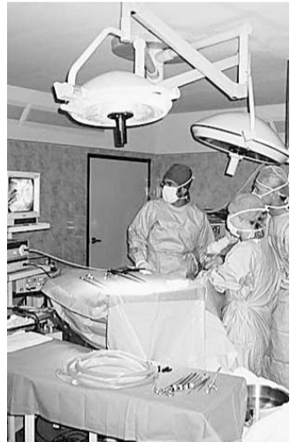
Die chirurgische Abteilung des hoch modernen Hospitals, das 2007 eröffnet worden war.