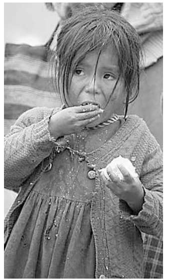
Armut und Krankheiten treffen besonders die Jüngsten.