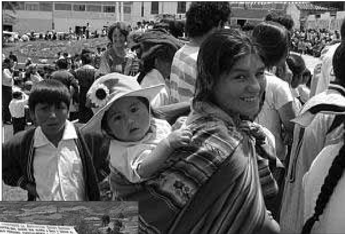
Die Hälfte aller Peruaner sind indianischer Abstammung (oben). Die meisten von ihnen haben noch nie einen Arzt gesehen. Für sie bauen die Johns das Krankenhaus im Bergland der Anden. Auf der ganzen Welt und vor allem in Deutschland haben sie Unterstützer gefunden. So konnte im Mai mit dem Bau begonnen werden (links). Schon 2007 soll das Krankenhaus fertig sein. Dann wird es wie auf der Computersimulation aussehen.

Der Name „Diospi Suyana“ stammt aus der Sprache der Quechua und bedeutet: „Wir vertrauen auf Gott“. Als christlicher Arzt habe man es leicht