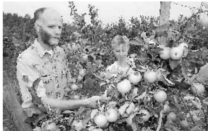
Unsere Äpfel sind frisch und knackig!